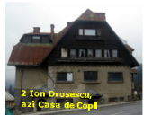
Casa Ton Drosescu, azi Casa de Copii cod L.M.I. 20159 PH-II-m-B-16676 adresa: Sinaia, Str. Furkica, nr.5 datarea: Inc, sec.XX stare precara de conservare