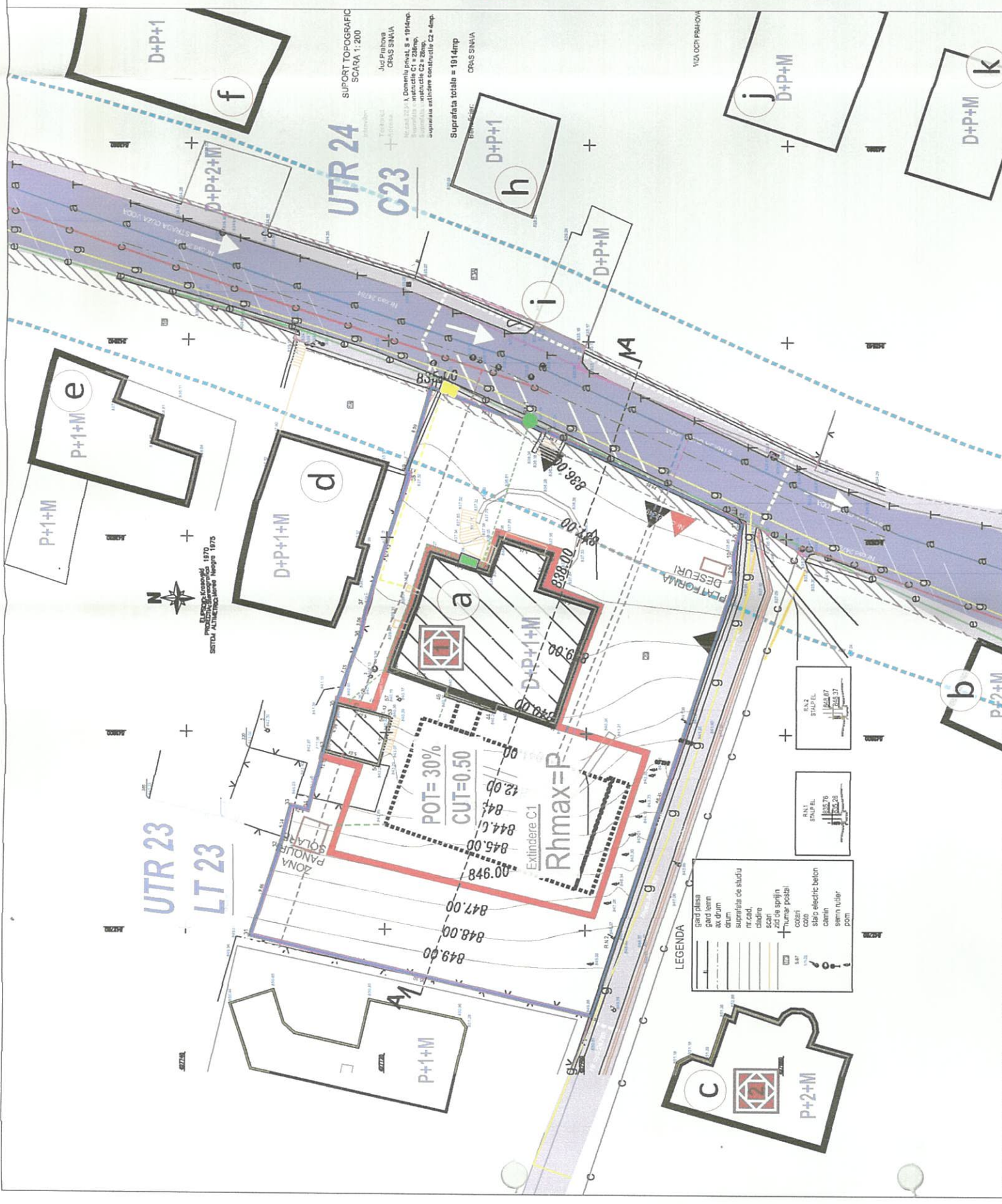
PROFIL STRADAL PROPUS AA- STRADA CUZA VODA